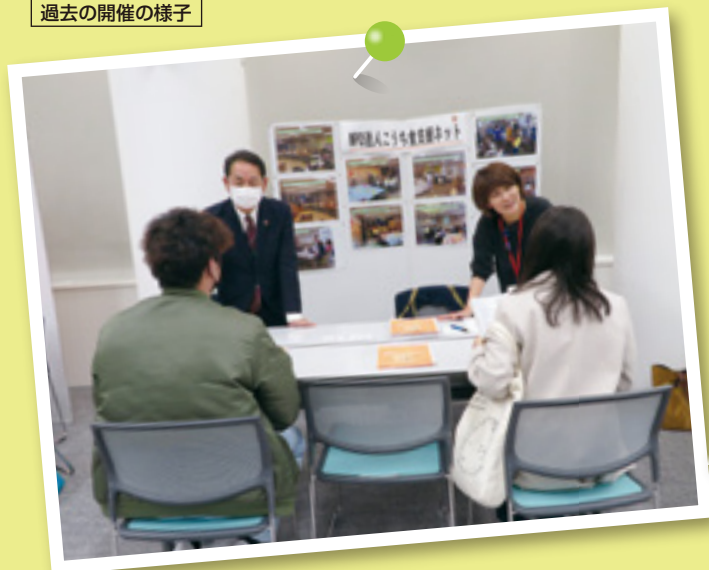
過去の開催の様子

「自分に合ったボランティア活動を見つけたい人」と 「ボランティアを募集したい団体」との出会いの場です。