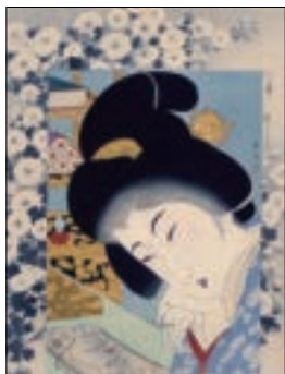
山本昇雲「今すがた 絵まきもの」

※期間中開催される作品解説等は、FacebookページやInstagramでお知らせします。