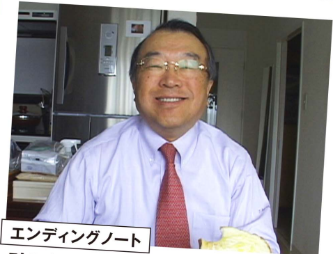
エンディングノート