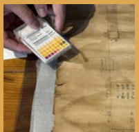
②リトマス紙を使って紙の状態をチェック。やや酸性寄りでした