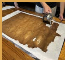
⑥溶液を吹きかけて汚れを下の紙に移すプロットを洗い試してみました。