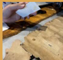
①水やアルコールで資料が傷まないかスポットテストを行いました