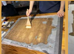
⑧最後にメチルセルロースを塗布して紙に潤いを与えておきます