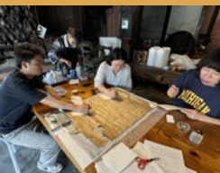
③ヒドロキシプロピルセルロースとエタノールを混ぜた液体で剥落どめを行います！