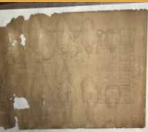
⑨紙に挟んで乾燥。前よりも鉛筆の線がはっきり見えるようになりました！