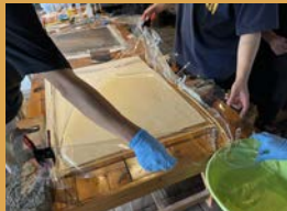
⑦作業を繰り返すと徐々に汚れも少なくなってきました