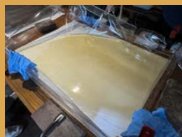
⑤資料を引き上げると汚れが液体に浮き出ていることがわかります。この作業を繰り返します。