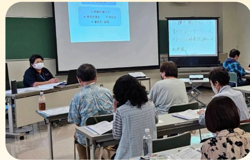
令和6年度 要約筆記者養成講座の様子

実際に受講をしてみて、自分の日本語の知識のなさや話をまとめること・パソコン入力など上手くいかないことが多く、軽く落ち込みますが、少しでも誰かの役に立てる日がくればとの思いで頑張っていこうと思います。