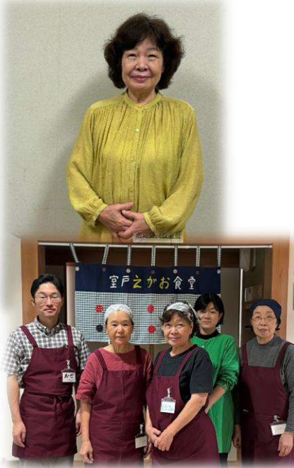
「室戸えがお食堂」実行委員会

活動は 1 人ではできない、実行委員会のメンバーやボランティアのスタッフが協力してくれるからこそ、活動が成り立っているという活動に対する熱い想いを話してくれた。